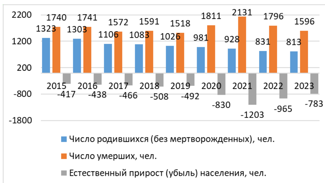
Рисунок 1.5-1 Естественное движение населения по округу, чел.

Показатели естественной убыли населения на территории округа увеличивал с 2015 по 2022 гг. с -3,5 до -9,9 промилле, следует отметить, что существенный скачок роста естественной убыли обусловлен влиянием коронавирусной инфекции. С 2022 г. начинается снижение показателя естественной убыли с 9,9 до 6,5 промилле. Коэффициент рождаемость за девять лет с 01.01.2015 года по 31.12.2023 года снизился с 11,0 до 6,8 промилле. Смертность после скачка роста в 2020-2021 г. начала снижаться и опустилась по итогам 2023 г. (13,3 промилле) ниже значения 2015 г. (14,5 промилле). Если рассматривать относительные показатели за 2023 г., то коэффициент рождаемости в городском округе ниже показателя, в регионе, который равняется 8,3, коэффициент смертности ниже среднего значения по республике Крым – 13,8 промилле против – 13,3 промилле.