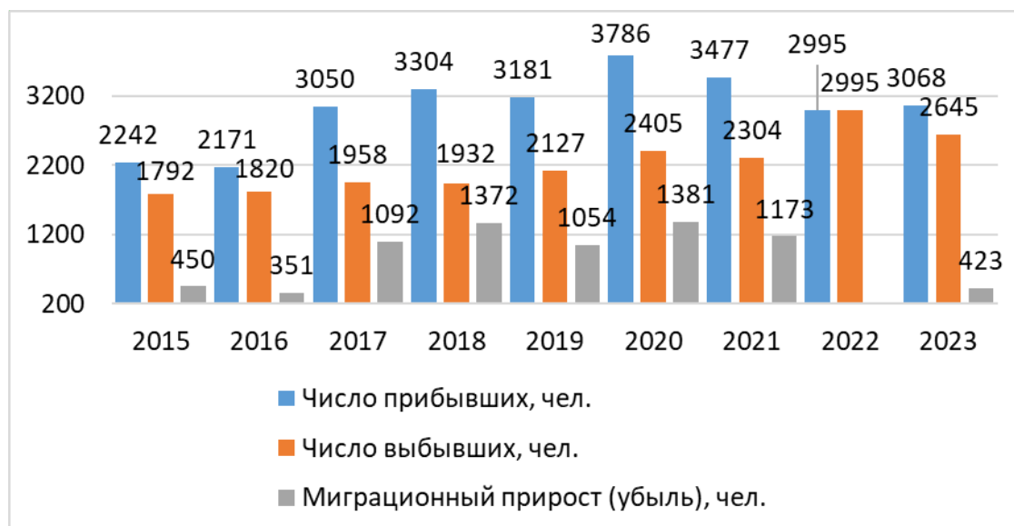
Рисунок 1.5-2 Механическое движение населения по округу, чел.

Динамика механического движения населения в городском округе Евпатория на протяжении последних 9 лет оставалась положительной. В миграционных процессах имеется следующая положительная тенденция – существенный рост приезжающих на 36,8% за 9 лет.